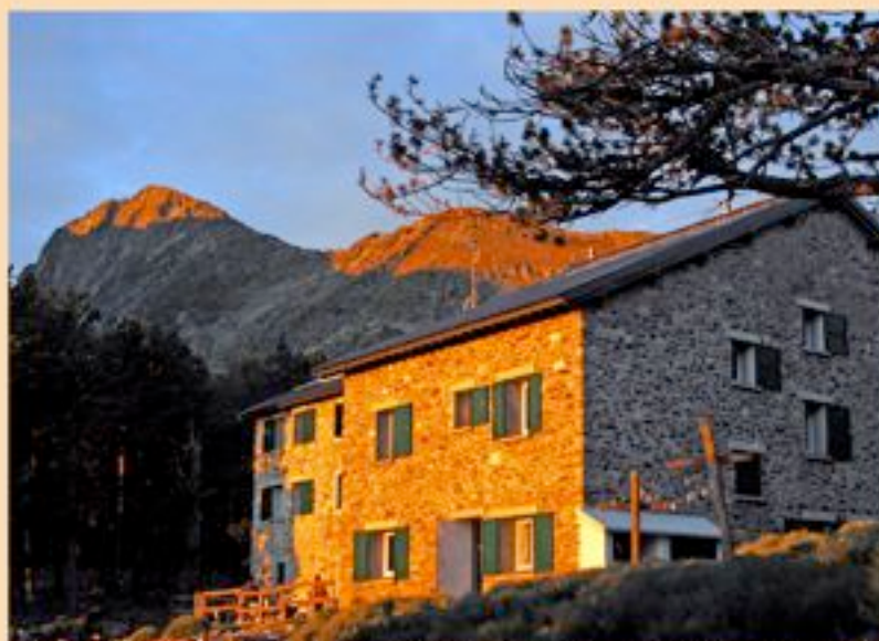
Pyrénées Orientales - Le Canigó 2784 m - le Refuge des Cortalets 2150 m