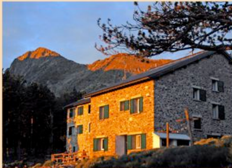
Pyrénées Orientales - Le Canigó 2784 m - le Refuge des Cortalets 2150 m