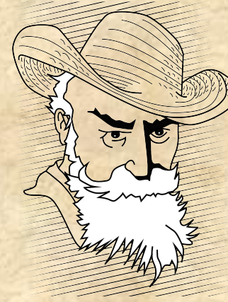
Le vieux berger