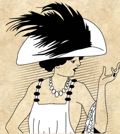
La Baronne Irik

« C'est forcément l'un d'entre eux le coupable. Tout le monde m'a vue quand je suis allée ranger les bijoux dans le coffre » déclarait la veuve du Baron Irik. Seulement voilà, malgré la fouille minutieuse de l'hôtesse, de sa bonne et de la douzaine d'invités, les bijoux n'ont pas été retrouvés par la police, ni sur les 'suspects', ni sur les lieux. « Je ne comprends pas. Mon bracelet n'a pas pu se volatiliser ! ». Interrogés, tous les convives admettent s'être rendus à une ou plusieurs reprises sur la terrasse du salon pour prendre l'air en cette lourde soirée d'été, mais les inspecteurs n'ont rien retrouvé sur ce petit balcon, ni dans la propriété.