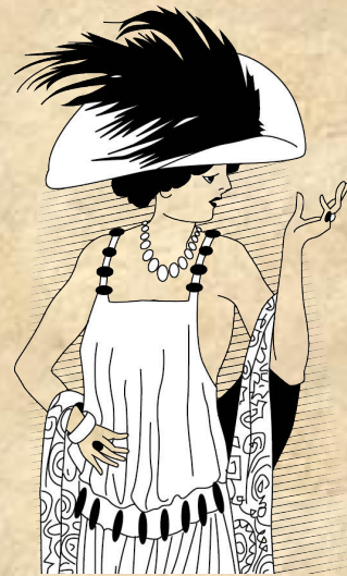
La veuve Lrik

Une nouvelle fouille minutieuse à la Manufacture de la Bonde a permis aux policiers de retrouver les bijoux au fond d'une malle à vêtements. Face aux accusations de la police, la veuve Lrik a fondu en larmes et a tout expliqué. « C'est vrai. Depuis la mort d'Archibald, j'avais des dettes. Je me suis dit que l'assurance des bijoux pourrait me rapporter gros si je mettais en scène un faux cambriolage. Finalement, j'ai monté cette histoire de vol et invité plusieurs personnes, avec l'idée de leur faire porter le chapeau mais surtout pour égarer la police. Le fermoir de mon bracelet ne s'est jamais cassé, malgré ce que j'ai prétendu devant tous mes invités. J'ai fait semblant de le mettre dans le coffre ». La Baronne avouera avoir attendu ensuite un moment où personne ne regardait pour sortir les bijoux cachés dans sa ceinture et les jeter par-dessus le balcon, hors de la propriété, alors qu'elle prenait un bol d'air. A deux pas, son complice entra alors en scène.