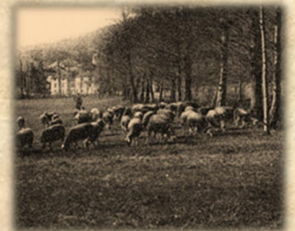
La sagne de La Bonde

Alors que les inspecteurs semblaient piétiner, un témoignage troublant a soudainement fait surface. La nuit du vol, le vieux berger de Cuxac-Cabardès ne dormait pas. « Je n'arrivais pas à trouver le sommeil, comme c'est souvent le cas en nuit de pleine lune. Je suis donc allé me dégourdir les jambes vers la sagne, le long de la Dure. Au loin, j'entendais la musique en provenance de la Manufacture. Je me suis assis à l'ombre des arbres quelques minutes, et c'est là que j'ai vu quelqu'un s'accouder au balcon. A cette distance, je n'ai distingué qu'une silhouette. Elle semblait regarder autour d'elle, comme si on la surveillait. Elle a fait un geste bizarre avec son bras, puis elle est repartie à l'intérieur ».