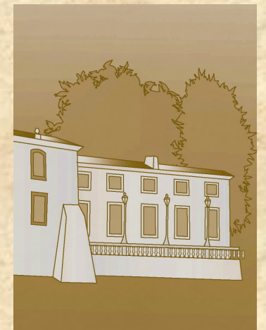
La terrasse du Domaine

Et le vieil homme de poursuivre : « J'allais me relever pour rentrer chez moi lorsque j'ai vu une personne d'allure masculine arriver sur le chemin communal, à hauteur du Domaine. Il s'est penché quelques instants comme pour refaire ses lacets, puis a repris sa route en sens inverse. Sur le moment je n'ai pas prêté attention à la scène, et je suis rentré chez moi. Ce n'est que quelques jours plus tard, en lisant le journal et en apprenant qu'un vol avait été commis à la Manufacture que j'ai repensé à tout cela ». Le récit du vieux berger qui garde son troupeau sur la sagne a intrigué les inspecteurs, qui en sont venus à l'hypothèse d'un forfait commis par deux complices, le premier subtilisant les bijoux puis les jetant à son comparse du haut de la terrasse. De nouveau interrogés par la police l'après-midi de ce témoignage, l'ensemble des 'suspects' a nié en bloc avoir participé à un tel forfait. Les fouilles minutieuses à leur domicile respectif n'ont rien donné non plus. Quant au mystérieux complice, il semble n'avoir laissé aucune trace. Ou presque.