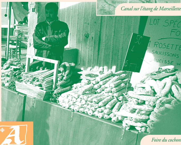
Foire du cochon