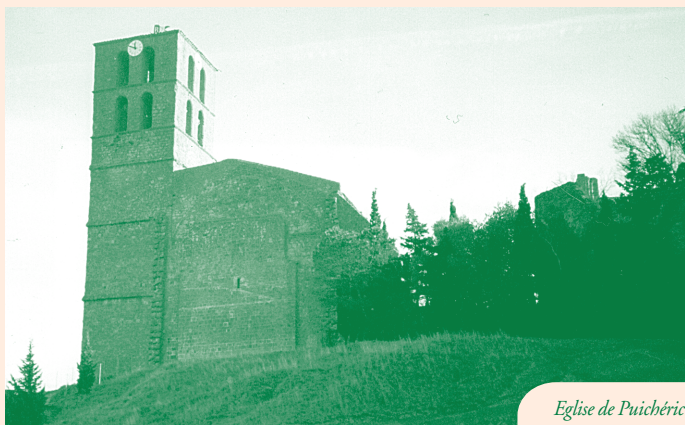
Eglise de Puichéric

Eglise du XIII e siècle contenant des peintures du XIII e siècle : visite possible , contacter la mairie - Tél. 04 68 27 89 89.