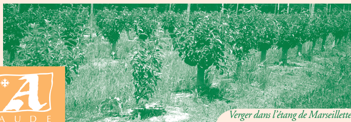
Verger dans l'étang de Marseillette

Empruntez la rue à gauche en arrivant devant la mairie, puis la rue Louis Pasteur jusqu'à l'église, revenez devant le jardin d'enfants dit « jardin de la paix » puis bifurquez à gauche ①. Après avoir passé les jardins, contournez sur la gauche et tournez à droite en direction du Canal du Midi jusqu'au pont-aqueduc et prenez à gauche en direction de l'Écluse de l'Aiguille ②. Prenez le temps de regarder les manœuvres d'ouverture et fermeture des portes de l'écluse lors des passages des bateaux ou des péniches ③. Amusez-vous devant de surprenantes et pittoresques sculptures réalisées par l'éclusier. Là enjambez le pont du Canal et dirigez-vous à gauche en direction du Foyer du Minervois ④ près de l'étang asséché de Marseillette qui a aujourd'hui fait place aux vignes, aux vergers de pommiers et aux rizières. Au-dessus des haies végétales, vous pourrez admirer les différentes techniques d'irrigation de l'étang. Puis revenir à l'Écluse de l'Aiguille et reprenez la rive droite du Canal du Midi, passer devant le pont de pierre et continuez jusqu'au pont métallique ⑤. Reprenez à droite en direction de la mairie.