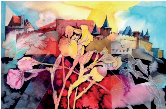
Cité irisée, 1994 Signé et daté en bas à gauche Aquarelle, 64 x 85 cm avec cadre Collection Beaubois Michelle

Jean Beaubois (Tourcoing, 1931-Carcassonne, 1998)