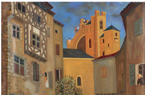
Cité et touristes Huile sur toile, 74 x 114 cm Musée des beaux-arts de Carcassonne

Paul Sourou (Carcassonne, 1824 - Carcassonne, 1921)