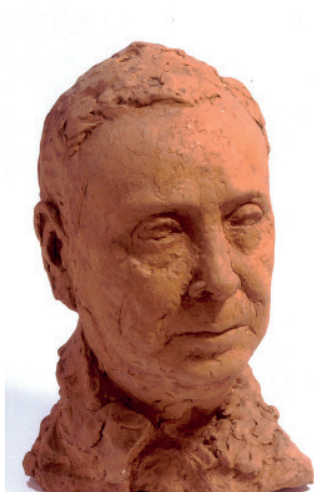
Paul Manaut (Lavelanet, 1882-Chalabre, 1959) Terre crue, 34 x 21 x 19 cm Musée des beaux-arts de Carcassonne

Yvonne Gisclard-Cau (Carcassonne, 1909-Carcassonne, 1990)