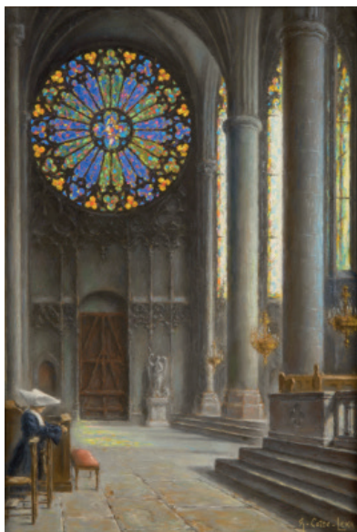
Intérieur de la basilique Saint-Nazaire, Signé en bas à droite Pastel, 55 x 38.4 cm Coll. Part.

Yvonne Gisclard-Cau (Carcassonne, 1909-Carcassonne, 1990)