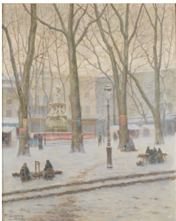
La place Carnot sous la neige Signé en bas à gauche Huile sur toile, 100 x 74 cm Musée des beaux-arts de Carcassonne

Paul Sourou (Carcassonne, 1824 - Carcassonne, 1921)