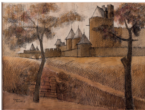
Sans titre, 1961 Signé et daté en bas à gauche Encre sur papier, 50 x 65 cm Collection Gilles Rousset ©Gilles Rousset