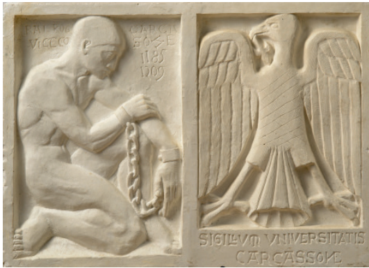
Raymond Roger Trencavel, Maquette lycée Paul Sabatier, Plâtre, 50 x 70 x 6 cm Musée des beaux-arts de Carcassonne