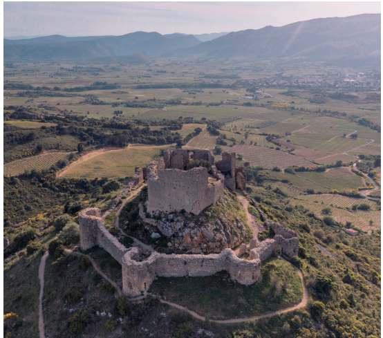
Aguilar et plaine de Tuchan / Paziols