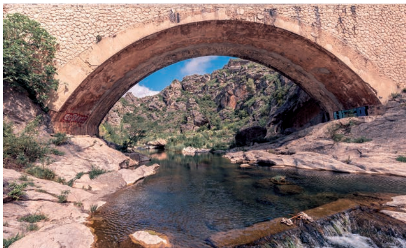
Pont sur la Berre

On passe devant une ancienne usine de plâtre désaffectée aux portes du village puis retour au point de départ.