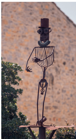
Représentation de Marcelin Albert