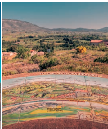
Table d'orientation à Paziols