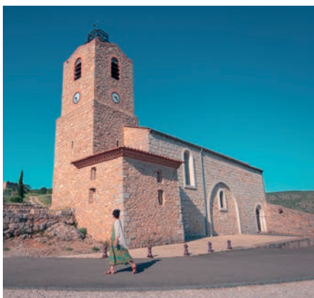
Église de Paziols

5 Puis prendre le chemin qui redescend au village au milieu des pins.