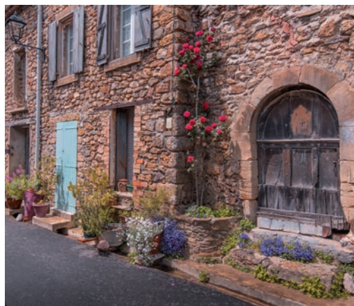
Village de Maisons