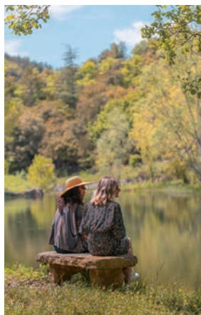
Lac de Maisons

5 Arrivée au Col de Ferréol, à l'intersection des routes D39 et D123 : Prendre direction Maisons sur 50m puis le GR36 qui part à droite (Balises blanc/rouge). Suivre le GR jusqu'à retrouver la route. Prendre la route à gauche et la suivre sur 30m avant de récupérer le GR qui part sur la droite et qui ramène au plan d'eau.