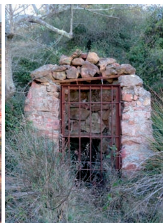
La Fontaine des Douaniers