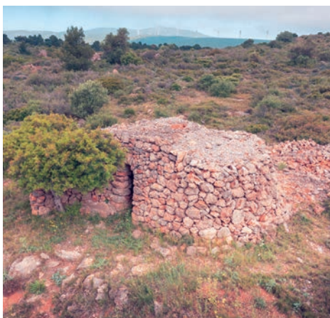
Capitelle, Pla de Ventenac