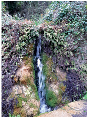
Source des Canelles

Arriver dans une vigne et la contourner par le bas. Puis un chemin à gauche amène sur un terre-plein qui rejoint bientôt le chemin de l'aller et la petite route qui descend au village.