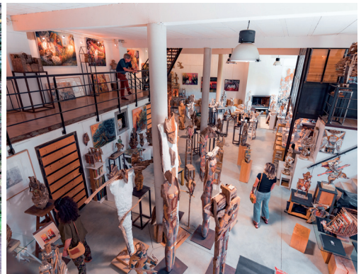
Atelier des Sentes