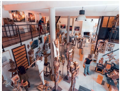
Atelier des Sentes