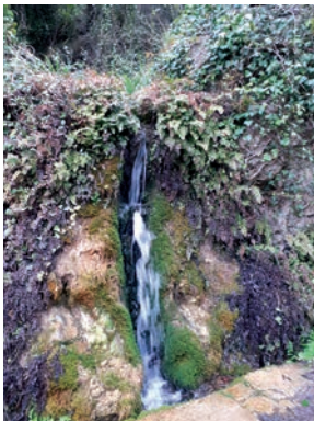
Source des Canelles

Arriver dans une vigne et la contourner par le bas. Puis un chemin à gauche amène sur un terre-plein qui rejoint bientôt le chemin de l'aller et la petite route qui descend au village.