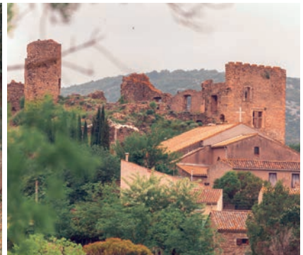
Château de Durban