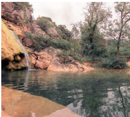
Cascade Les Pausades

6 Le sentier coupe une piste. Continuer jusqu'à la route en contrebas. Aller à gauche sur quelques mètres. Prendre à droite. Traverser un lotissement. Un peu plus loin, recouper la route. Continuer à descendre entre les maisons vers le village puis la mairie.