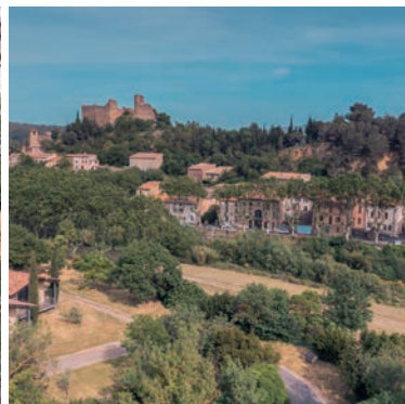
Village de Durban