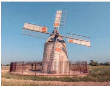
Moulin à vent

9 Longer la route sur la droite pendant 50 m environ. Attention à la circulation ! Suivre une bande d'herbe étroite le long d'une propriété grillagée. À la fin du grillage, virer à gauche, traverser la route pour prendre le chemin en face. Le suivre jusqu'à revenir au premier croisement (les 4 chemins) et prendre le chemin de droite qui ramène sur le parking des moulins, puis au moulin à eau.