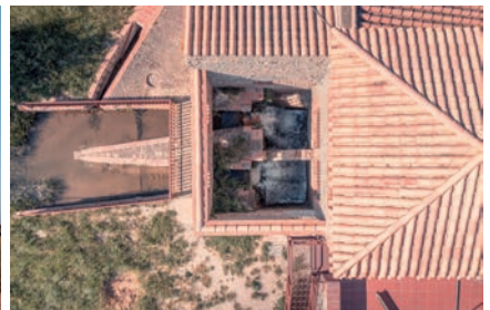
Moulin à eau