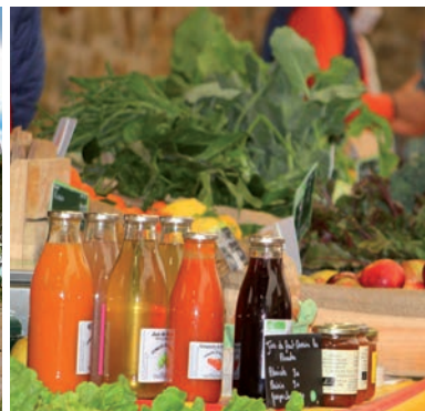
Marché de Clairà