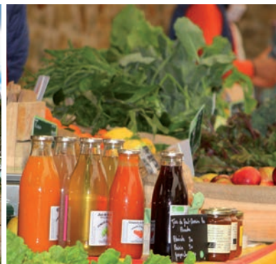
Marché de Clairà