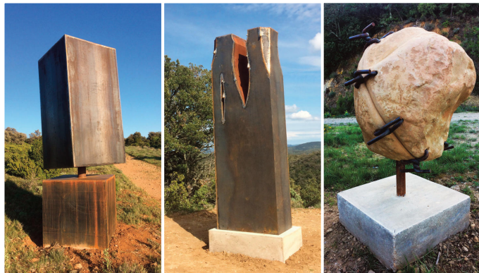
A L'auguste pencheur acier B Bancale banquise acier C Chirurgie de campagne et de plein air - pierre acier

Robert Cros - Route de Saint Laurent - 11200 Fabrezan Tél. 06 84 14 50 21