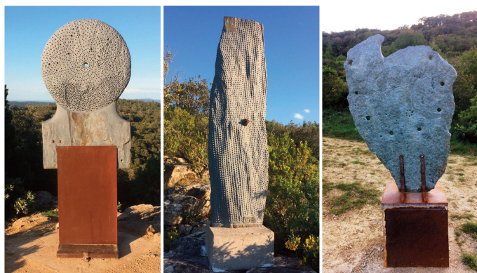
D Je suis mort a Alep Schiste E Chronique d'un voyage solitaire - Schiste H Le voyage de Victorine Schiste

Bozo - Tél.02 40 54 32 62/ 06 41 70 42 43 rialand.marie@wanadoo.fr