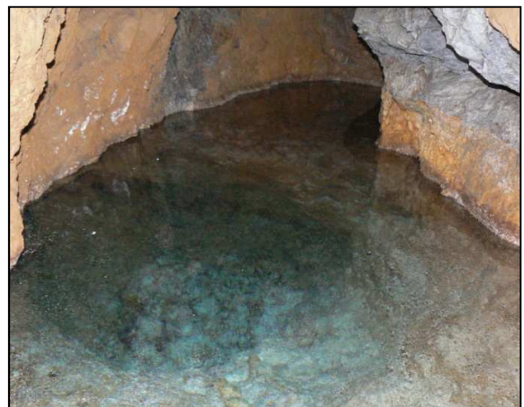
Col de Couise : Mine de l'Aiguille