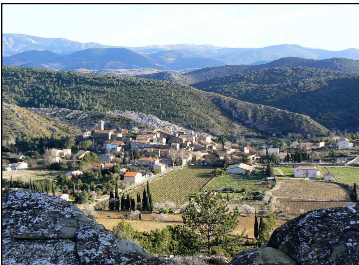
Relief du massif de Mouthoumet vu des hauteurs d'Albas