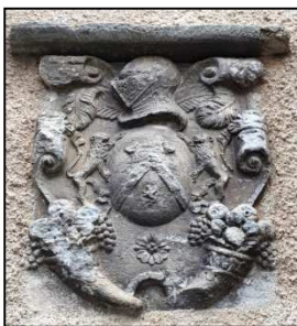
Villeroze-Termenès Blason de Dagobert