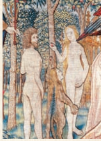
Tapisserie de «la Création du Monde», fin 15 e siècle