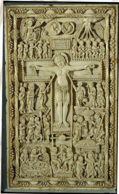
Crucifixion, 9 e siècle

La visite du Trésor complète celle du chœur de la cathédrale également orné d'oeuvres de premier plan : les somptueux tombeaux des archevêques, le retable gothique sculpté en pierre polychrome au sein de la chapelle Notre-Dame de Bethléem, la tapisserie du Baptême de Clovis (17 e siècle) dans la chapelle du Sacré-coeur, ou bien le tableau de La chute des anges rebelles de Rivalz (fin 17 e siècle) au-dessus de l'autel de la chapelle Saint-Michel.