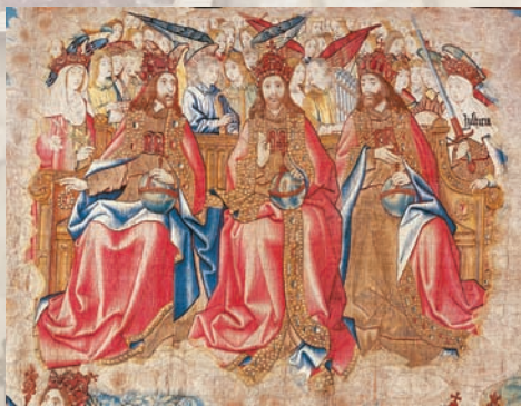
Tapisserie de «la Création du Monde», fin du 15 e siècle

Billet Pass : 9 € et 6 € en tarif réduit