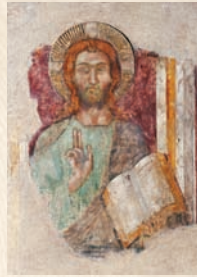
Christ bénissant, fresque, 14 e siècle