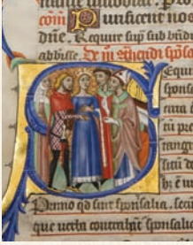
Pontifical de Pierre de la Jugie, 14 e siècle