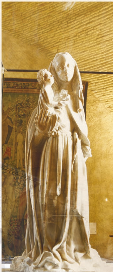
Vierge à l'enfant, 15 e siècle

La coupole confère à cet espace une particularité sonore remarquable : en vous plaçant dans un angle face au mur, vous pourrez communiquer à voix basse avec votre interlocuteur placé dans l'angle opposé, sans être entendu du reste de la pièce.