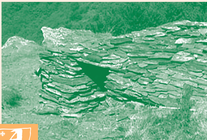
Capitel : abri de pierres sèches au sommet du Quiersboutou

❺ S'engager dans la descente, hors sentier, en suivant les cairns et le balisage au sol. Passer sous la ligne électrique et atteindre un col situé au dessus du hameau de Serremijeane. Traverser un chemin herbeux peu marqué et 50 m plus loin, repérer à droite une sente qui descend en se faufilant au milieu des genêts. ❻ La suivre dans les châtaigneraies jusqu'à un chemin de terre, qu'on suit à droite sur 50 m pour prendre à gauche la voie goudronnée qui mène au hameau de Thérondel-Bas. ❼ Descendre à gauche en longeant la maison et atteindre la rivière. Passer le pont et remonter en face. Au débouché sur une piste, prendre à droite sur 50 m seulement. ❽ Quitter la piste à gauche pour un sentier qui grimpe rapidement pleine pente. Il atteint la D189. Prendre en face le dernier raidillon jusqu'à la voie goudronnée du hameau de Bourdials. La suivre à droite, au bout du goudron poursuivre tout droit par le sentier en sous-bois ; il passe sous le hameau de Raissac et débouche sur la D9, juste avant la montée au parking de Cayac.