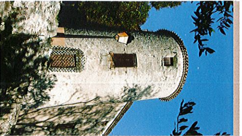
CHÂTEAU DE LEUC

Ce village de 623 habitants, dominé par la colline des Justices, point culminant de la commune (288 m), se situe à 10 km au sud de Carcassonne, sur la rive droite du Lauquet, affluent de l'Aude, 2 km en aval. Dans le village, se dresse la masse imposante du château, castrum , de Leoco, cité dès 1110. Du vaste édifice rectangulaire aux quatre tours d'angle et au puissant donjon, œuvre de l'archevêque Pierre de