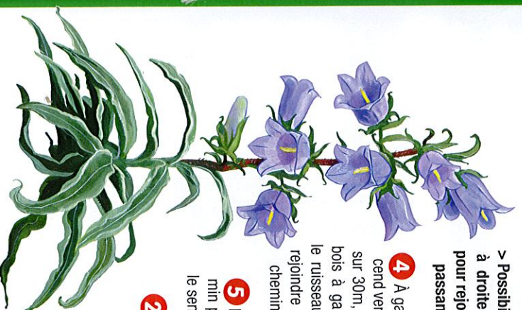
CAMPANULE À BELLIS FLEURS /