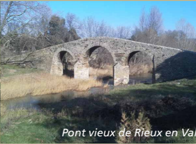
Pont vieux de Rieux en Val