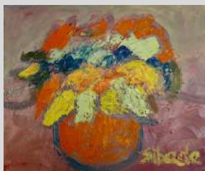
Rétrospective Michel Sibade

Exposition du 21 février au 13 mars Vernissage vendredi 21 février à 18h30