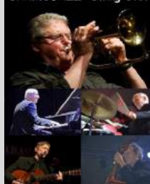
GRAMOJAZZ "Swing 5tet"