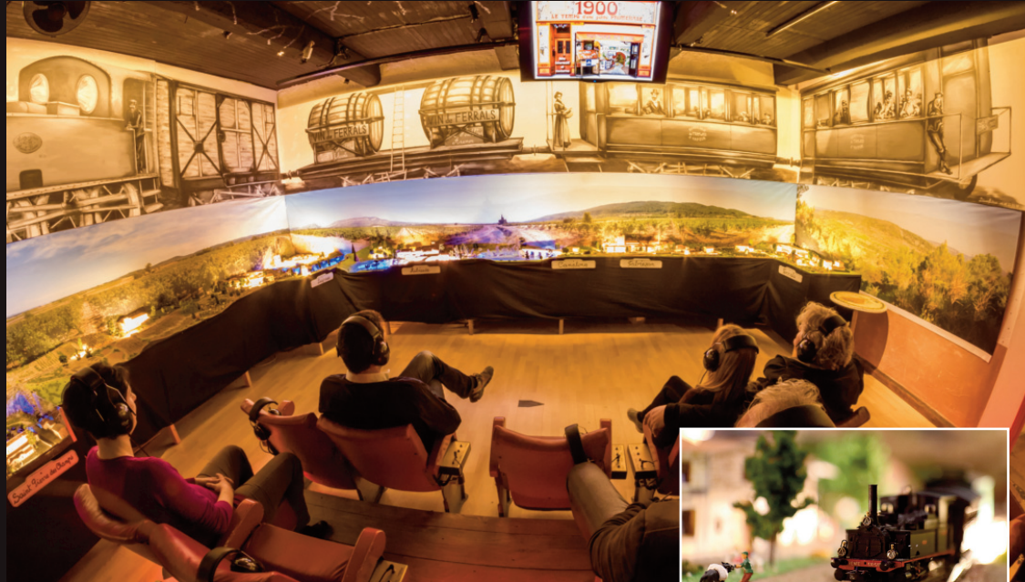
SPECTACLE 4D SUR L'ANCIEN TRAMWAY DE L'AUDE