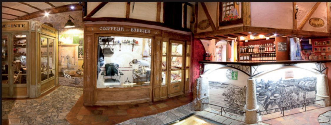
RECONSTITUTIONS DE LA VIE ET DES MÉTIERS EN 1900