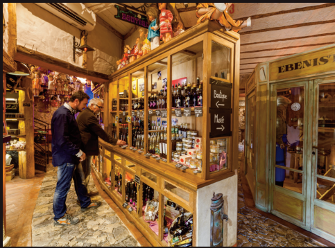
DÉCOUVREZ LAGRASSE AU SIÈCLE DERNIER

Adulte : 4.50€ - Enfant : 1.50€ Groupe : 3€ - (8 personnes minimum) Groupe avec dégustation 5€ avec plateau de toasts, (tapenade, confits...)