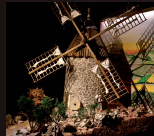
EN 1900 AUX 4 SAISONS