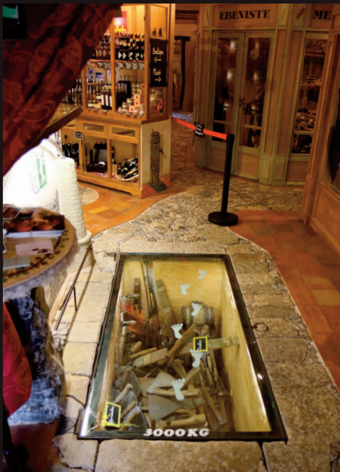
VOYAGEZ DANS 300M 2 AUDIO GUIDÉ