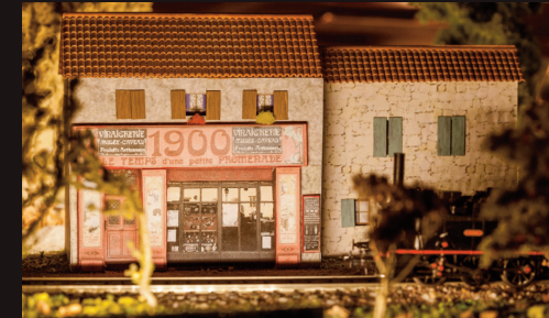
SPECTACLE SON ET LUMIÈRE