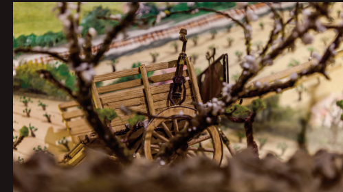
PLONGEZ DANS LES CORBIÈRES